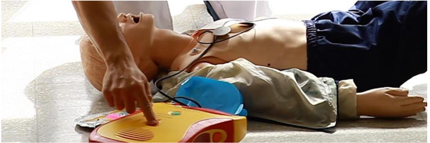
Figura 7. Desfibrilador externo automático.

En Uruguay desde el año 2009 se promulgó la ley N° 18.360 que refiere la obligatoriedad de disponer de un DEA en espacios públicos o privados donde exista afluencia de público. (7)