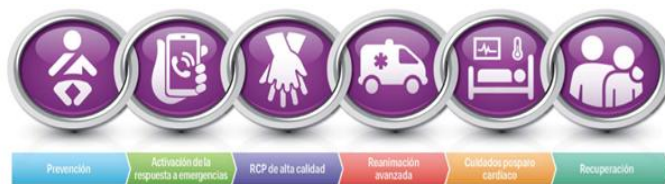
Figura 1. Cadena de supervivencia del RCP pediátrico. Aspectos destacados de las guías de la American Heart Association del 2020 para RCP.

Estas medidas forman parte de la llamada cadena de supervivencia (figura 1) de lactantes y niños, que incluye acciones salvadoras dirigidas a reducir el número de muertes y es diferente a la del adulto. Cada eslabón de la cadena debe ponerse en práctica lo antes posible para aumentar la sobrevida (2-6) .