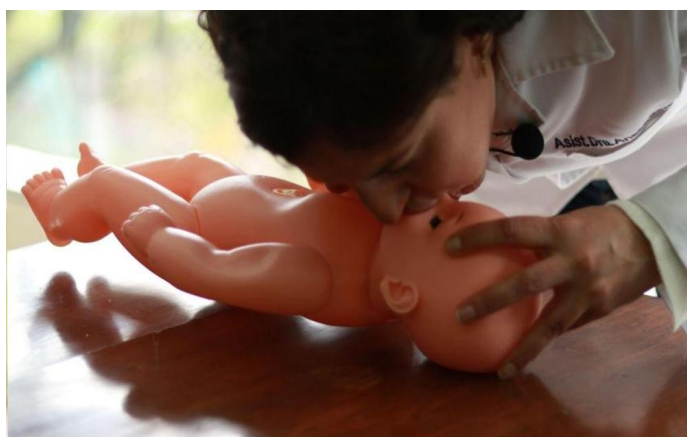
Figura 3. Posición para la respiración artificial