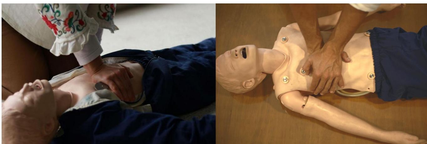
Figura 5. Masaje cardíaco en niños y adolescentes. En A (figura izquierda) se observa el masaje cardíaco con una sola mano. En B (figura derecha) se observa la misma maniobra con 2 manos, recomendada para mayores de 8 años.