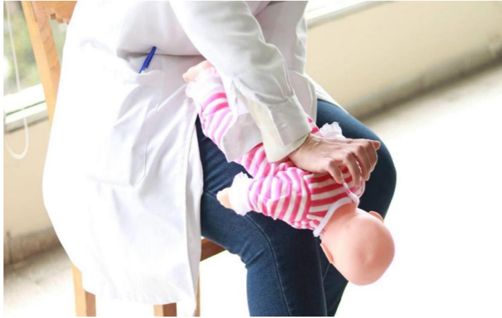
Figura 9: Posición “boca abajo”.