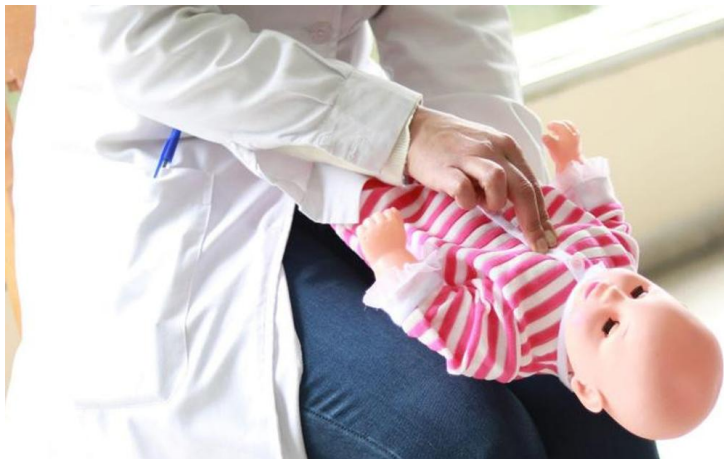
Figura 10: Posición boca arriba.