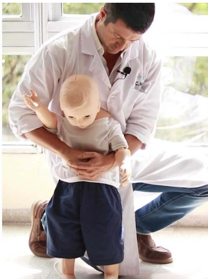
Figura 11: Posición agachado en niños pequeños.