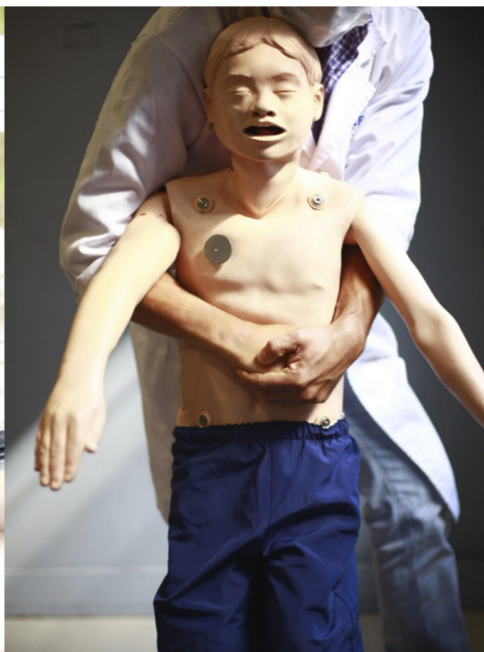
Figura 12: Posición de pie en niños grandes.