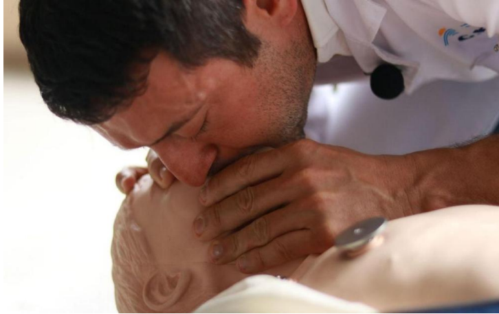
Figura 6. Respiración "boca a boca" en NNA.