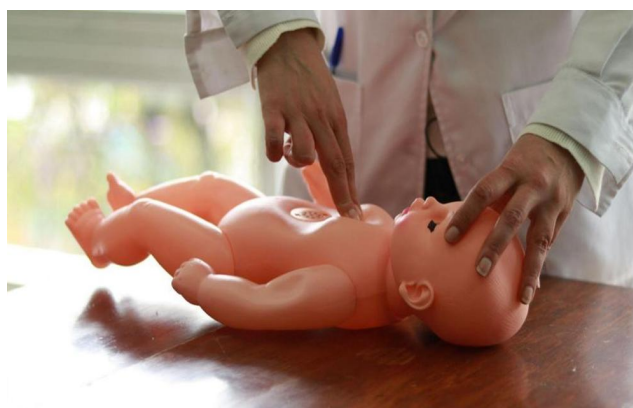
Figura 2. Masaje cardíaco en recién nacidos y lactantes.